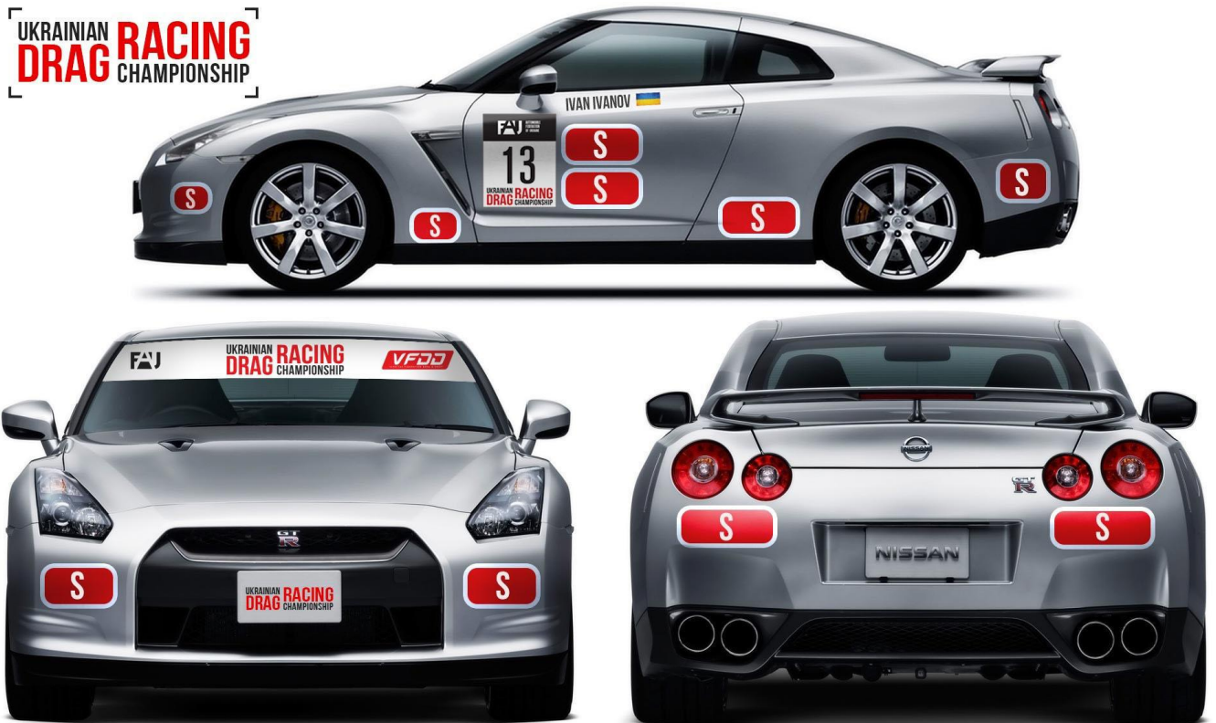
Наклейка на лобовое стекло.

За порушення цієї вимоги Представник пеналізується грошовим штрафом, розмір якого повинен бути вказаний в Індивідуальному Регламенті змагання. Але такий штраф не може перевищувати розмір Заявочного внеску до відповідного класу (у випадку, коли заявочні внески відсутні – відповідно до стандартного внеску), у якому допущено даний автомобіль.